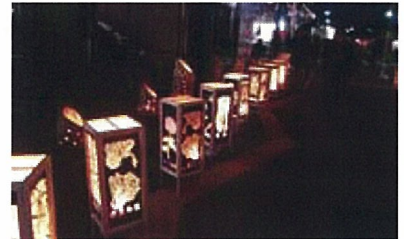
黒磯駅前通りのキャンドルナイト。多くの市民が、夕闇に揺れるやさしい光を楽しみます