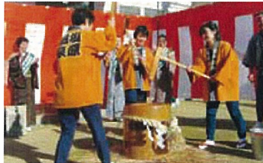
毎冬恒例の塩原温泉女将もちつき祭り。つきたての餅をあんこ餅やきな粉餅、おしるごなどにして振る舞います