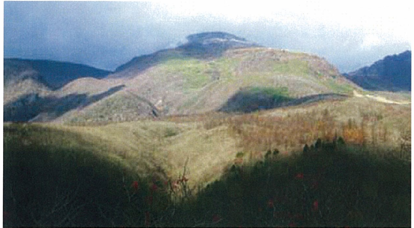
冬になり、雪が降る前には、那須登山もおおすすめです

那須の冬といえば、やはりスキー。冷えた身体を温泉でのんびりと温めるのもよいでしょう。また隠れた自分なりの楽しみ方を見つけるのもおすすめ。ゆったりと那須探訪をしに来てください。